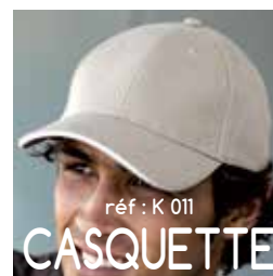
réf : K 011 CASQUETTE