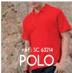
réf : SC 63214 POLO