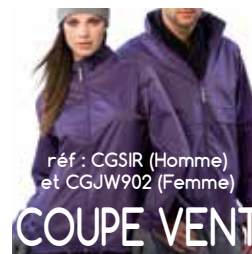
réf : CGSIR (Homme) et CGJW902 (Femme) COUPE VENT