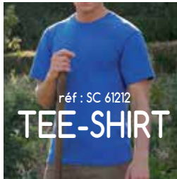
réf : SC 61212 TEE-SHIRT

INCLUS Marquage 1 couleur, 1 position, Format A4 maxi Frais technique inclus Sérigraphie ou Transfert suivant quantité et article.