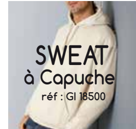
SWEAT à Capuche réf : GI 18500