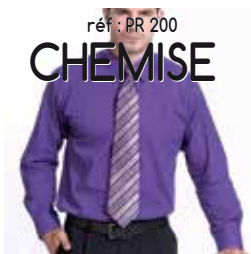
réf : PR 200 CHEMISE

Taille 38 à 45 / 65 % polyester + 35 % coton 105 gr