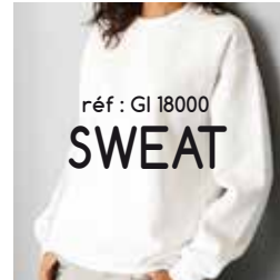
réf : GI 18000 SWEAT