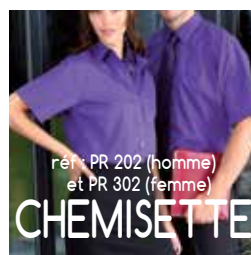
réf : PR 202 (homme) et PR 302 (femme) CHEMISETTE

Taille 38 à 45 / 65 % polyester + 35 % coton 105 gr